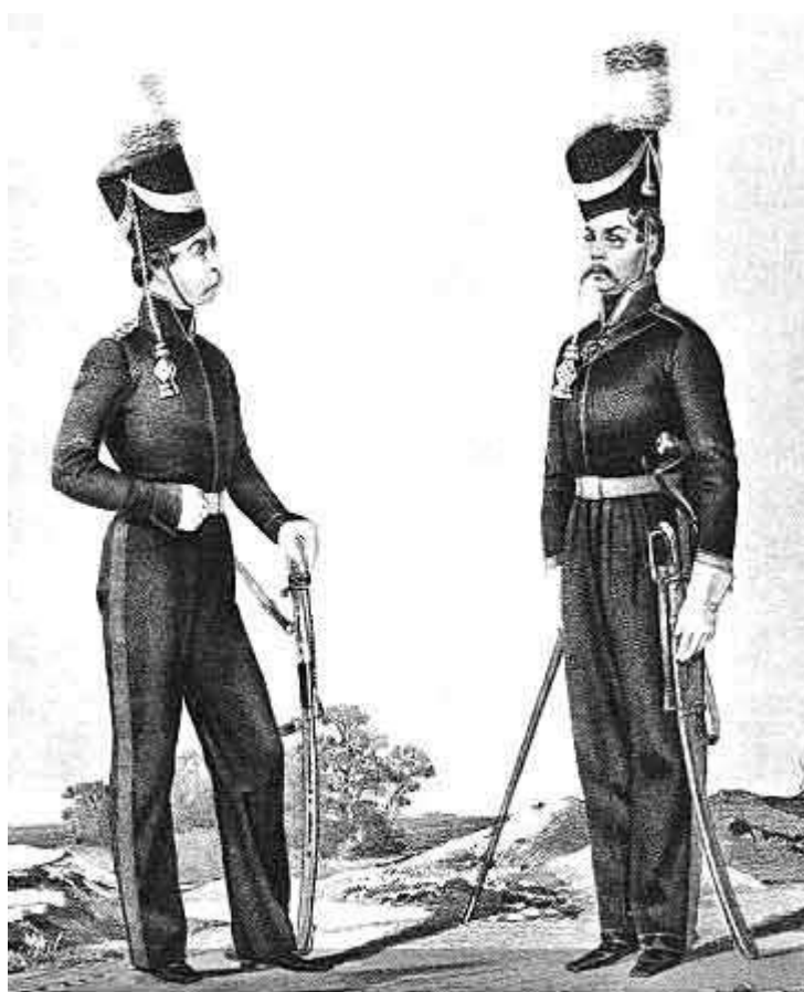
ОФИЦЕРЪ и УРЯДНИКЪ

В 1808 году вследствие войны с Наполеоном, все полевые регулярные войска, находившиеся до этого времени в Сибири, были передислоцированы в европейскую часть России, а охрана Сибирской линии целиком легла на сибирских казаков, и вплоть до конца XIX века сибирские казаки являлись основой российских вооруженных сил в Сибири.