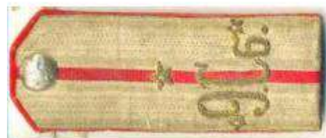
На снимке слева: войсковой знак Сибирского казачьего войска